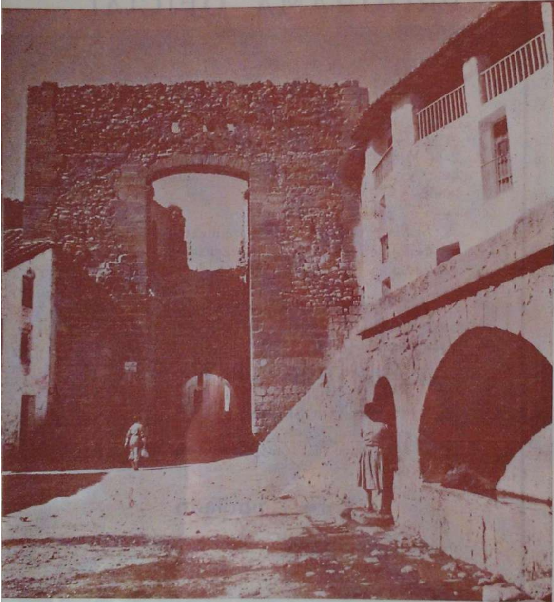
Plaza de los Olmos