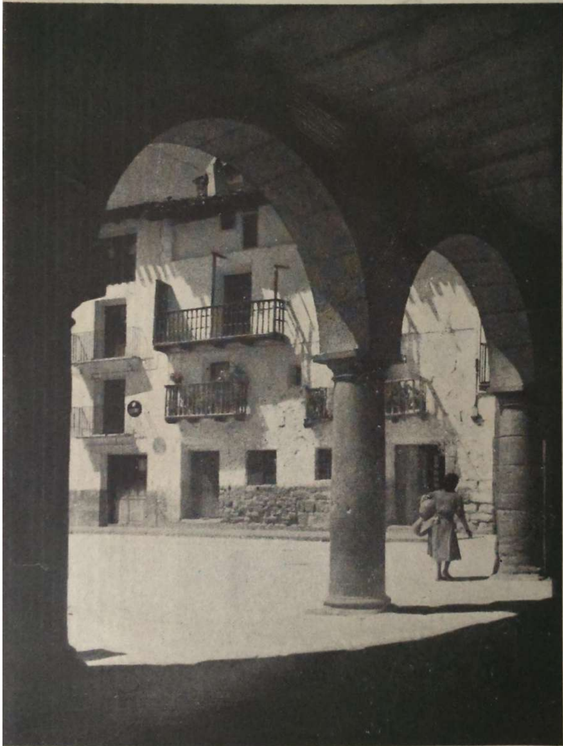
Arcos del Ayuntamiento