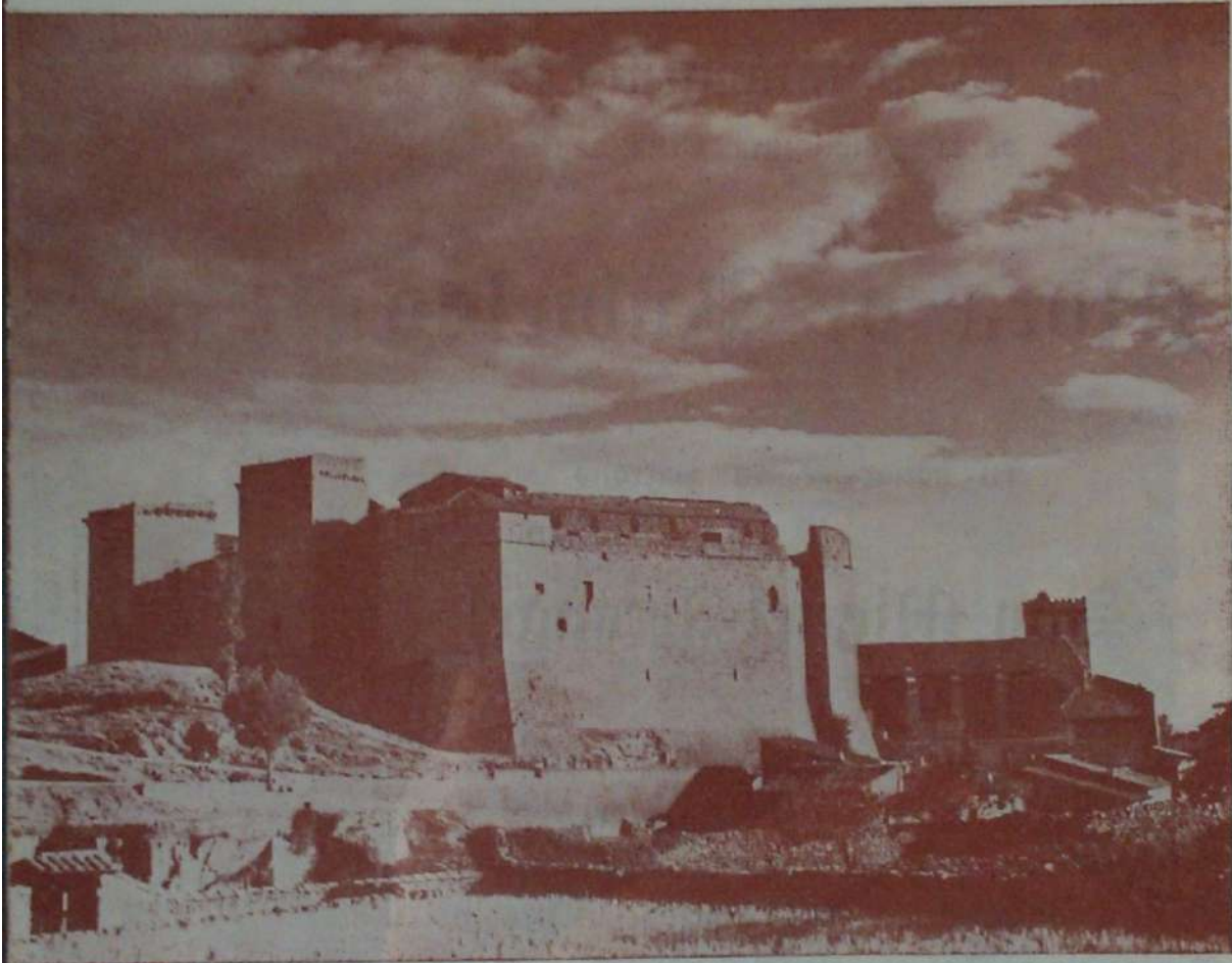
El Castillo (Siglo XV)