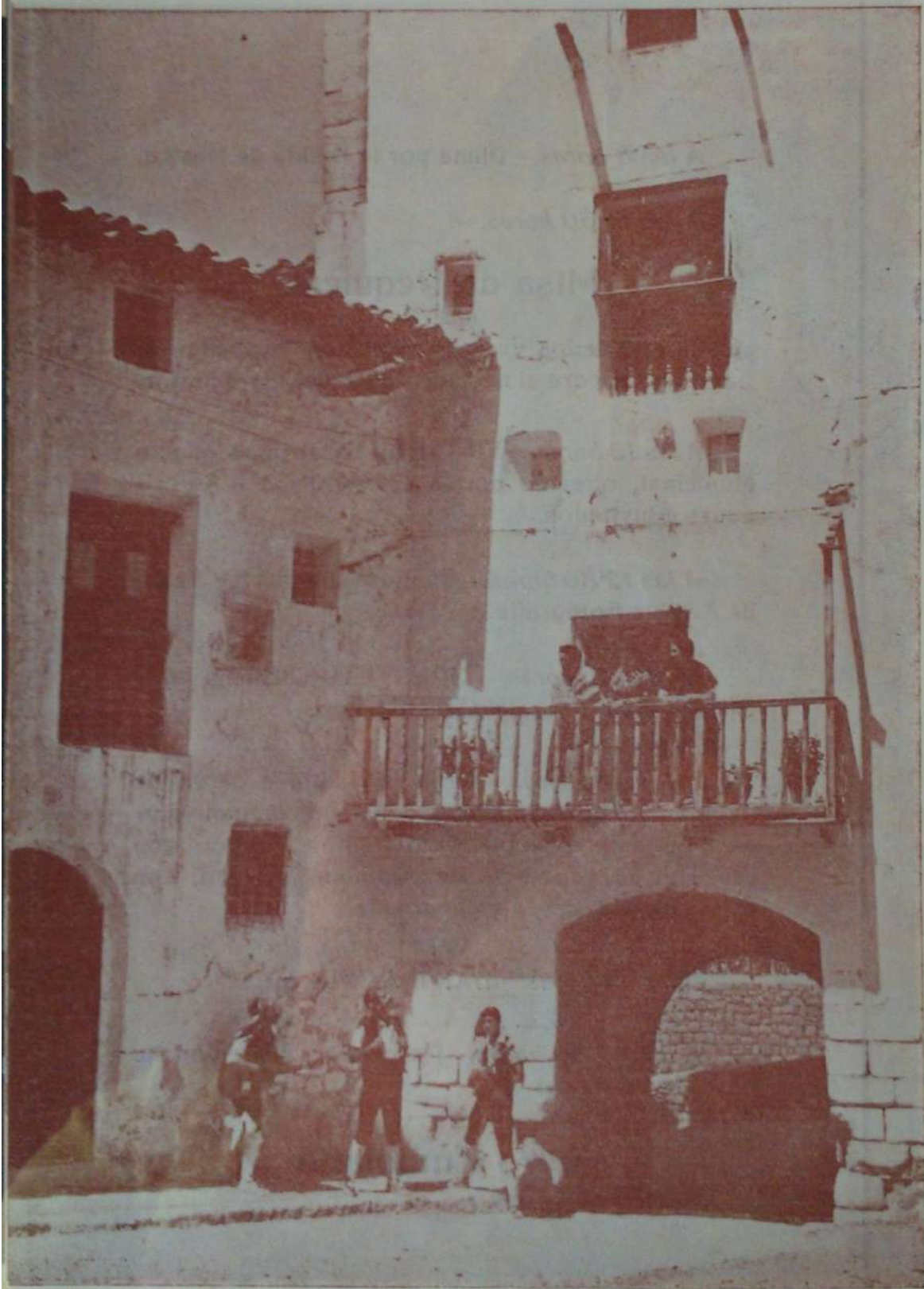
Plaza de las Monjas