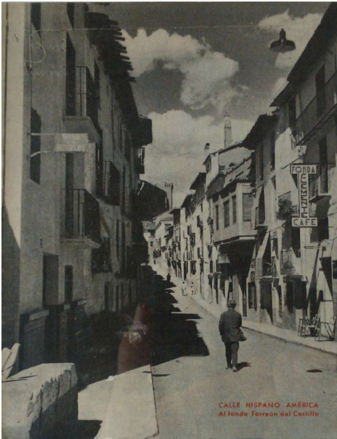
CALLE HISPANO AMÉRICA Al fondo Torreón del Castillo