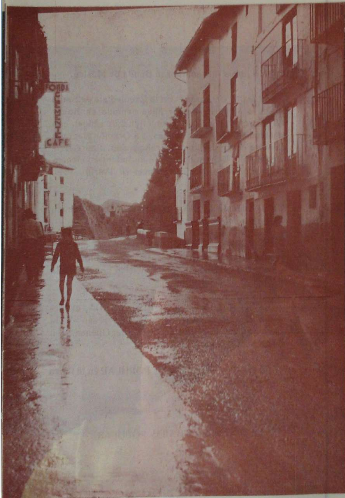
Vista parcial de Mora y entrada a la población